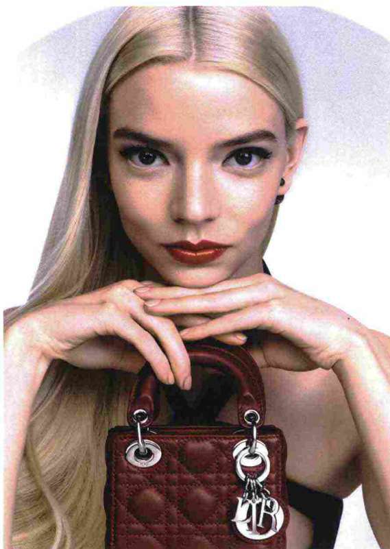
ANYA TAYLOR-JOY, LA NUOVA MUSA DIOR.

Per effetti immediati e duraturi, DIAMOND di NATURA BISSE svolge un'azione sculpting per modellare l'ovale del viso. Prodotti esclusivi, nati dalla collaborazione tra Profumerie Mazzolari e Natura Bissé , luxury brand cosmetico spagnolo.